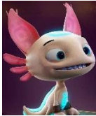
Un axolotl (ajolote)